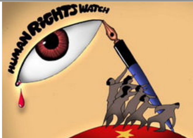
Giải Nhân quyền Hellman-Hammett 2010