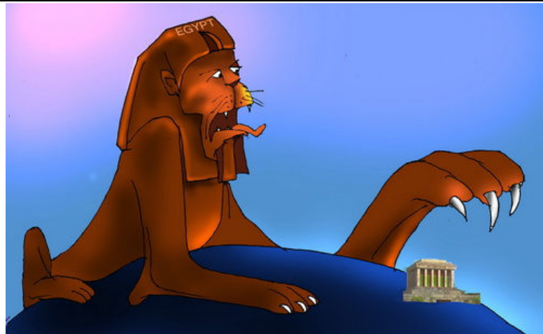
Từ Ai Cập đến Ba Đình (Babui-Danchimviet.info)