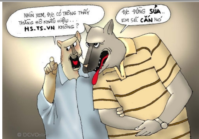
CSCĐ - Chó săn của Đảng (Babui-DCVOnline)

Tất cả các sự kiện ấy không cho thấy cộng đảng Việt đã lộ nguyên hình, lời cả mặt ư? Có sao vẫn chỉ phản kháng giặc ngoài mà chẳng cảnh giác thù trong? Có sao vẫn chỉ chống đối Trọng Thủy ngoại thù và chẳng thanh toán Mỹ Châu nội gián? Hay tệ hơn, cứ sao vẫn bình chân như vại, chỉ biết đến sự yên ổn của bản thân, gia đình hay cộng đoàn mình? Đợi khi thắng Việt cộng leo lên gần ngôi sao vàng vào lá cờ 5 sao của thắng Tàu cộng thì mới phản ứng chẳng??? BAN BIÊN TẬP