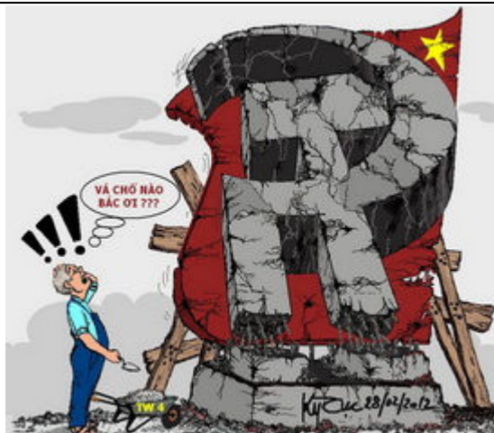
Và Đảng từ đâu? (Kỳ Cục-Danchimviet.info)