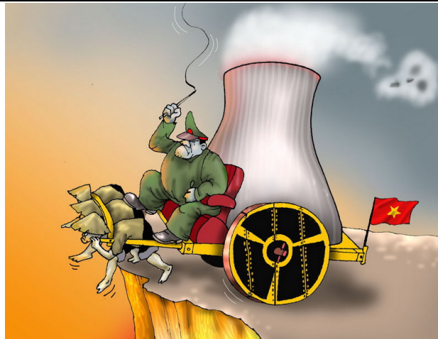
Dự án tham những điện nguyên tử (Babui-Danchimviet.info)