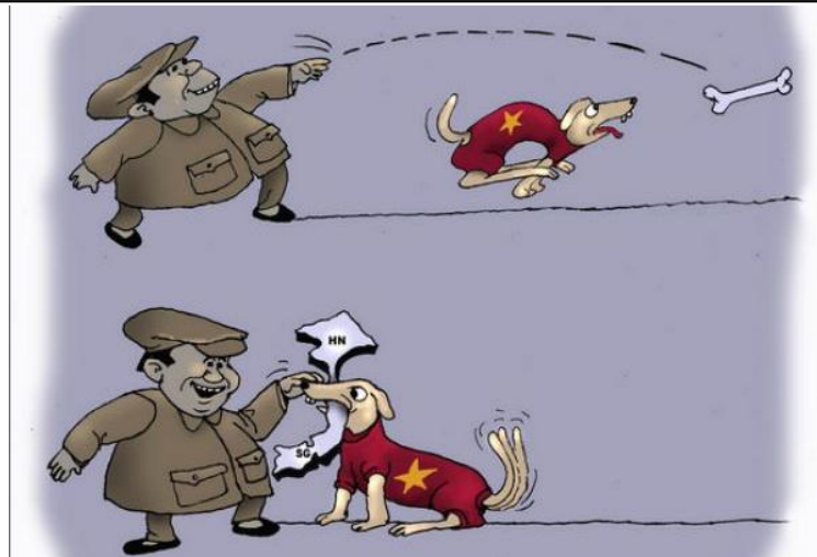
Chó Ba Đình (Babui - Danchimviet.info)