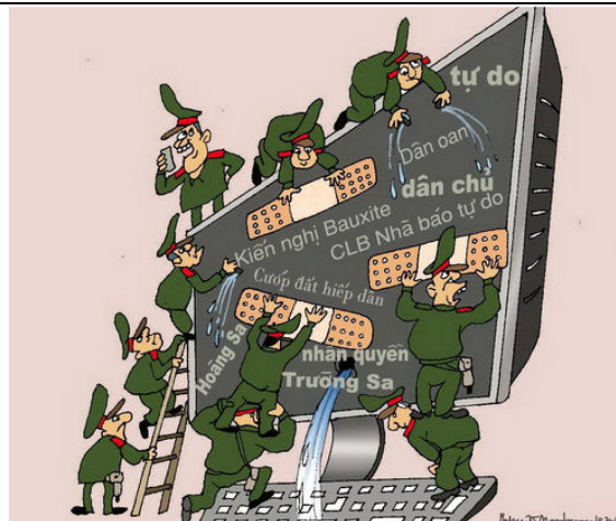
Đăng và Internet (Babui-Danchimviet.info)