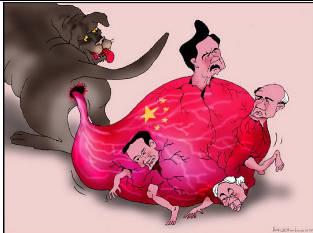
Số để bóc điều (Babui-Danchimviet.info)