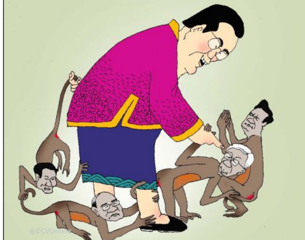
Bọn háng gian ở Ba Đình (Babui-DCVonline)