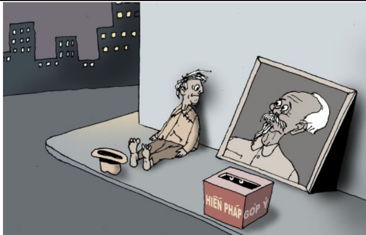
Góp ý sửa đổi Hiến pháp (Babui-DCVonline.net)

Xấu hổ, liêm sỉ là một trong những đức tính Ông Trời phú bẩm cho con người để xây dựng nhân cách, chùn tay trước điều xấu định làm, sửa chữa những lỗi lầm đã phạm và thay đổi lối ứng xử, cách hành động của mình, đặc biệt đối với tha nhân và xã hội trong tương lai. Nhưng lịch sử mấy mươi năm của đảng CS cho thấy đức tính này hầu như vắng bóng hoàn toàn nơi các đảng viên, nhất là nơi hàng lãnh đạo đảng. Thảo nào chính trị ngày càng hà khắc, kinh tế ngày càng suy thoái, đạo đức ngày càng lụn bại, xã hội ngày càng hỗn loạn và đất nước ngày càng lâm nguy! BBT